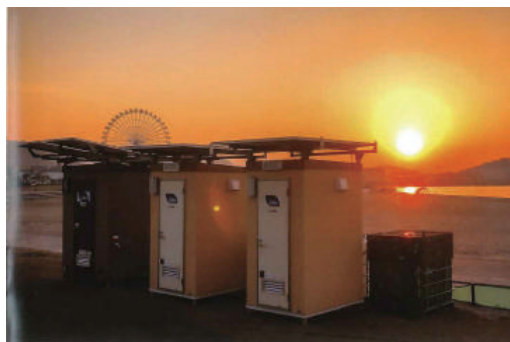
【ラグーナビーチ SII型】

熊本地震の際に、災害ボランティアセンターでご利用していただきました。地震では上水管と下水管が甚大な被害を受けます。災害ボランティアセンターに設置し多くの方にご利用いただきました。鏡もあり、着替えもでき、当たり前の水洗トイレがうれしいという声を頂きました。