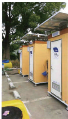
【災害避難所 駐車場/SII型】

熊本地震の際に、災害ボランティアセンターでご利用していただきました。地震では上水管と下水管が甚大な被害を受けます。災害ボランティアセンターに設置し多くの方にご利用いただきました。鏡もあり、着替えもでき、当たり前の水洗トイレがうれしいという声を頂きました。