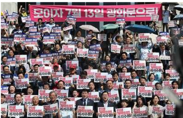
6野党と市民社会団体が記者会見し尹政権を糾弾

昨夏、水害による行方不明者を捜索中だった海兵隊員が死亡した事件に絡んで捜査に圧力がかけられた疑惑を特別検察官に