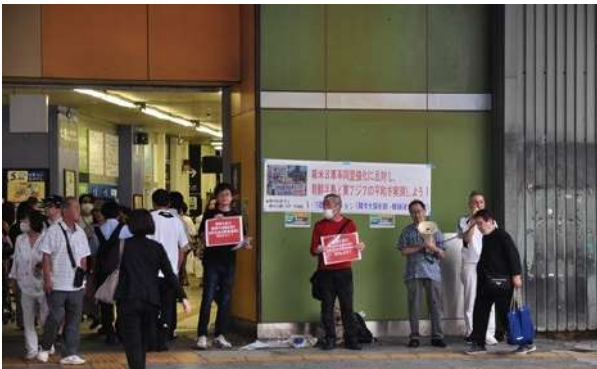
アピールする参加者たち

6月27日から朝鮮半島近海で韓米日合同軍事演習「フリーダム・エッジ」が実施される中、韓統連大阪本部と韓青大阪府本部は29日、JR鶴橋駅前で「第2回鶴橋