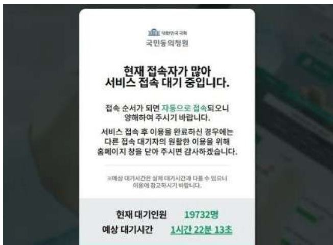
弾劾請願サイト。申請者が殺到し、接続が大幅に遅延している

●尹大統領弾劾請願、2週間で100万突破…「国民の審判」無視し「独断と専横」続ける政権に国民の怒り