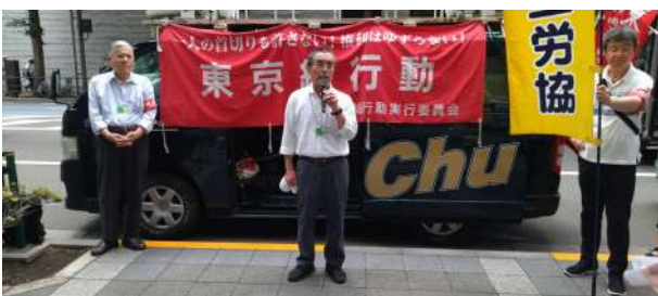
「日本製鉄元徴用工裁判を支援する会」がアピール