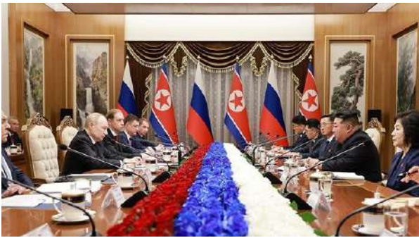
朝口首脳会談 (6・19 平壤・錦繍山迎賓館)