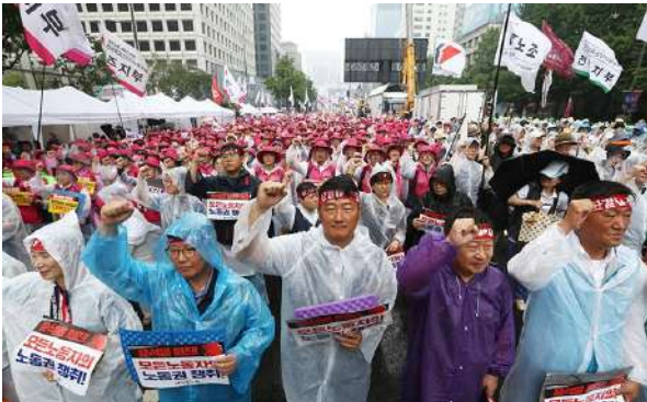
「民主労総」全国労働者大会（6・22 ソウル）

「民主労総」は6月22日、ソウル市中区の崇礼門からソウル市庁まで続く世宗大路を労組員ら3万人でぎっしり埋め、「労働者の賃上げ 全ての労働者の労働権爭取 全国労働者大会」を開催。賃上げ闘争の勝利と労働権獲得を実現し、尹錫悦（ユン・ソンニョル）政権退陣闘争の導火線となろうと決意した。民プラス（6月22日）の記事を紹介する（一部省略）。