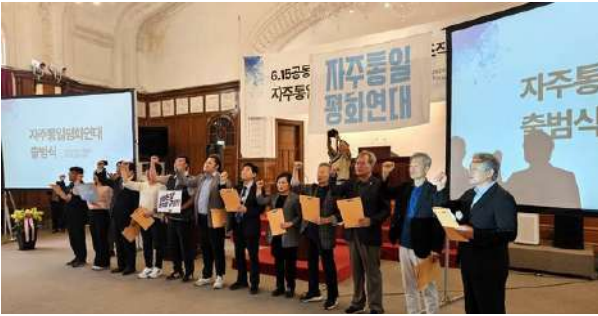
「自主統一平和連帯」出帆式（6・15 ソウル）

6・15共同宣言実践南側委員会は6月15日、ソウル市鐘路区仁寺洞の天道教中央大教会で組織転換のための総会を開催し、同委員会の解散を決定すると共に、新しい組織として「自主統一平和連帯（平和連帯）」の発足を宣言した。