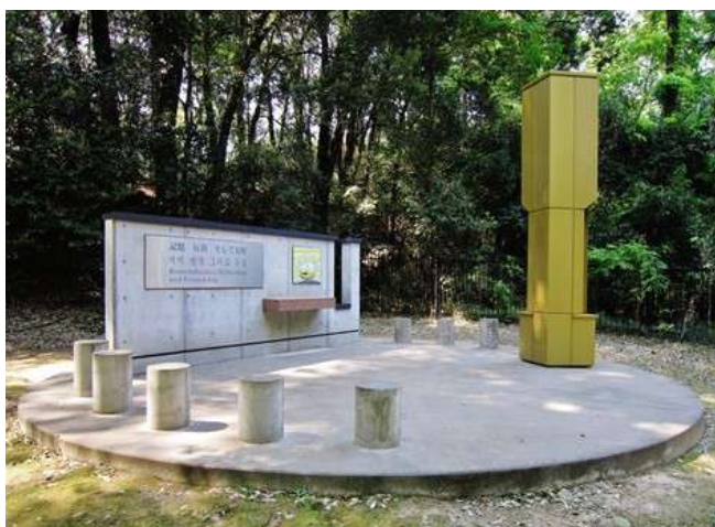
「群馬の森」に設置されていた「朝鮮人強制連行被害者追悼碑」

植民地支配・強制动員の歴史を反省し繰り返さないという決意が込められていた」として、「群馬県は歴史の前に恥じなければならない」と指摘した。