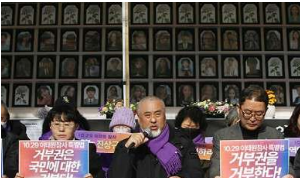
遺家族協議会の記者会見