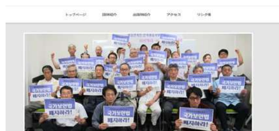
韓統連ホームページ