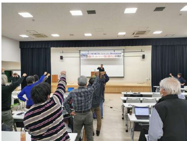
参加者全体で団結ガンパローを唱和

「韓国オプティカルハイテック労組を支援する会結成集会」が1月25日、都内で開催された。主催は同「支援する会」(準備会)。