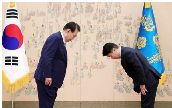
李東官放送通信委員長（右）を任命する尹錫悦大統領