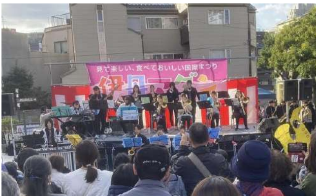
神戸朝鮮高級学校・尼崎朝鮮中級学校吹奏楽部の公演

11月19日、「第27回伊丹マダン」が兵庫県伊丹市の三軒寺前広場で開催。天候にも恵まれ、会場には多くの地域住民が詰めかけ大盛況となった。主催は韓統連兵庫本部、韓青兵庫県本部が参加する実行委員会。