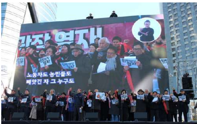
100人の代表者が舞台上で「民衆10大要求案」を朗読

11月11日にソウルで「尹錫悦(ユン・ソンニョル)政権退陣総決起」が6万人規模で開催された。同日、ソウルでは韓国労総の「労働者大会」(5万人参加)や