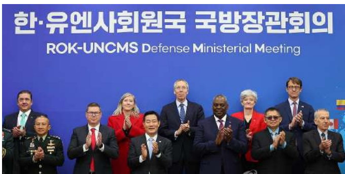
ソウルで初開催された韓国と国連軍司令部加盟17カ国代表による会議

韓国と米国は11月13日、ソウルで定例安保協議(SCM)を開催し、北朝鮮(※正しくは朝鮮、以下同じ)の核・大量破壊兵器の脅威抑止を目的に国防相間で交わす戦略文書「オーダーメイド型抑止戦略(TDS)」を10年ぶりに改定した。